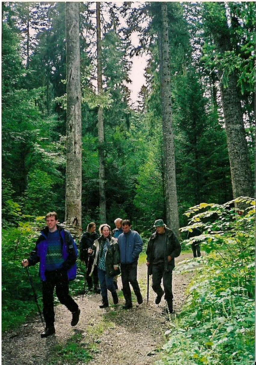
Die Landesgruppe auf gutem Wege

Tietmeyer, M. (1996). Durch Struktur und Mischung aus der Krise. Natur- und Landschaftskunde , S.